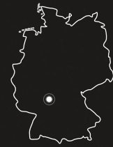
Freudenberg am Main