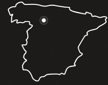
Ribera del Duero